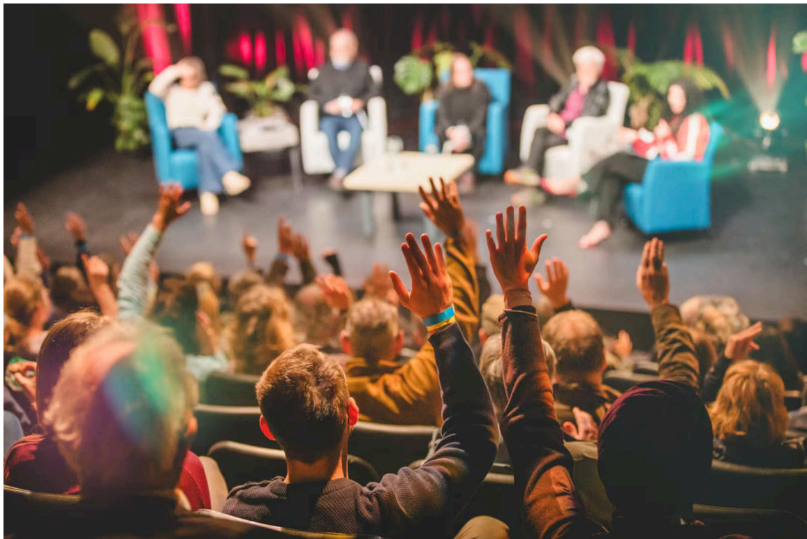
Le Festival international de journalisme de Carleton-sur-Mer revient pour une 4e édition, du 14 au 17 mai prochains.